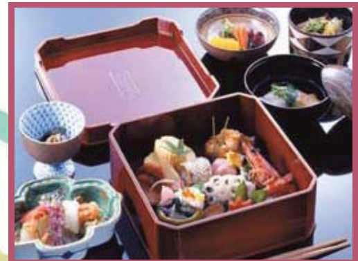
おもてなし弁当 大徳寺弁当 ¥5,000(税別)

「自宅での慶弔事に」 ご結納 お見合 ご披露宴 成人式 厄祝い お宮参り お七夜 七五三 お誕生日会 結婚記念日 入学祝い 卒業祝い 就職栄転祝い 母の日 父の日 お茶会 敬老の日 ご法要やお盆などのお集りに 「会社、学校などの公共の催事に」 歓送迎会 記念行事 式典など 「お出掛け、レジャーに」 お花見会 観劇 運動会など